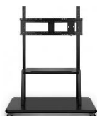
VB-STND-001 Rollwagen EAN 76690794761 8