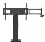
VB-STND-004 Elektrisch höhenverstellbarer Bodenstandfuß EAN 76690798341 8